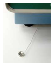
Sistema de apertura manual de la tapa en caso de fallo eléctrico.